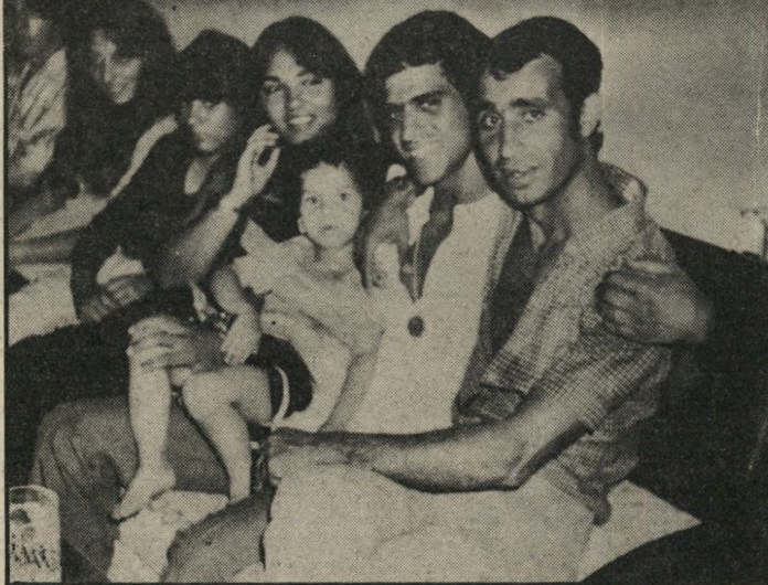
בגלל הבן המישפט באשקלון למישפט של הבן כשהוא בגילופין. לכן הואשם בזיון בית-המישפט ונזר עליו חודש מאסר.