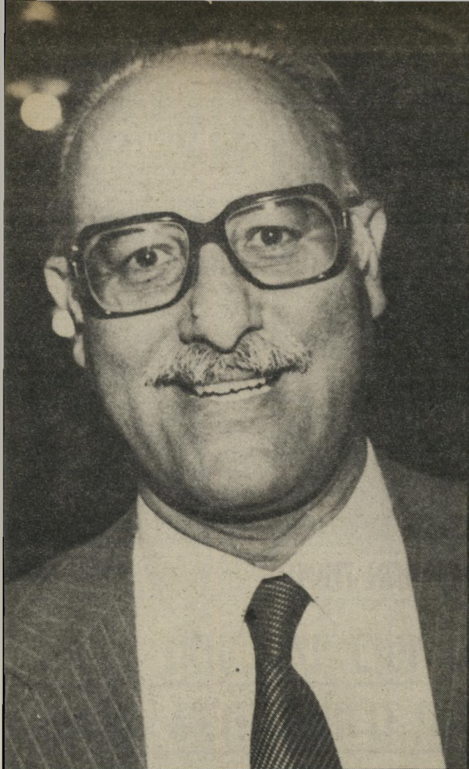
שופט אריה אבנארי שגגה מן הקולמוס

גם אילו רצה בכך, לא יכול השופט לתקן את הטעות המזוזה — כי אסור גם לו לשנות פסקי דין