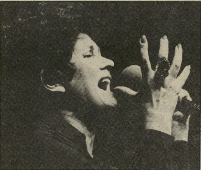
זמרת ירקוני לחילהשדה, לתיירים, לישראלים