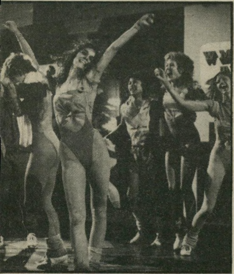
סינתטיה דייל בג'ופית שמימיים' כמה טיפיות סכס

צרות בג'רדן (דקל ארצות-הברית) - ארנסט (להיות או לא להיות) לוביץ טוען, שמבחינה סינרגית זהו סירטן המושלם ביותר, ומאחר שהוא נורע כבעל מגע הקסם, כדאי להיווכח כמה מדובר, זוהי אחת המהתלות האלגנטיות, הפיקחיות, המצחיקות