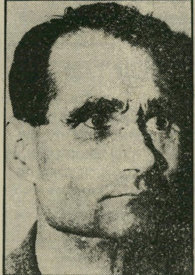
הס (בכלא שפאנדראו) לא יודע על ההסרטה

לחזור על אותו בירשם עצמו: מלשדנס ומוטלוס הזניקו את הצופים הצעירים לקולנוע כמו כדור-המריץ את הספורטאים הרוסים בתחרויות בינלאומיות, הבא בתור - גופות שמימיים לפי אותו הבירשם: ריקוד אירובי פלוס כמה טיפיות סכס וכמה סנטימטר אהבה. את הכל קושרים במבנה אחת עם סיפור לא מסוכך מדי: מורה לריקוד צעירה ונהמדה חולמת להקים ביתי אולפנא שכולו שלה ובדרך גם מישפחת את