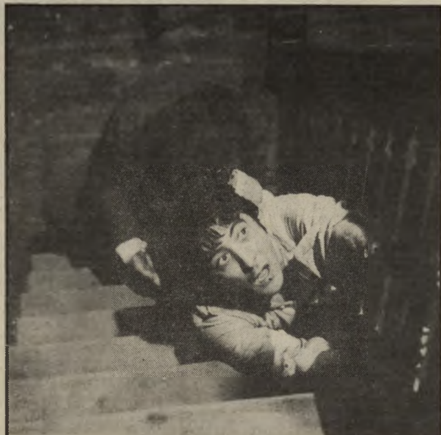
דאסטין הופמן ב"כוכבי הקט" עריכה מהירה הקרנה מואטת

סרטיו של פקינפה ניהנו תמיד במידה עצומה של אלימות, אותה הביא לדרגה עליונה של סגנון, עד כדי כך שכונה "פיקאסו של האלימות". הוא רטן וטען שאינו מקבל את הכינוי, אם הוא מראה את התפרצויות הזעם ה"אנושי" ואת תוצאותיו הזועמות, זה רק כדי להעמיד את האדם מול פני האלימות הנוראה הנצורה בתוכו פנימה. הוא היה מעריץ נלהב של האנתרופולוג רוברט אדרי ושל כתביו, וטען שסרטיו שואפים להעמיד את הצופה מול מלוא הכיעור השוכן בו פנימה. "הטלוריה הקתה את חושינו עד כדי כך שעוד הרוג אחד אינו עושה רושם על איש. אבל פעם אחת כראי היה שנראה מקרוב את הנקב שמשאיר