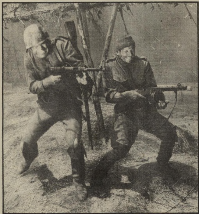
גרמני ואמריקאי ב"צלב הברזל" התאבדות למען דרגה

כאלה: שני האקדוחנים המודקנים באקדחים אחרי הצהריים. השודר דים בחבורת הפראיים. קייבל הוג, שחי ממכירת מים לסוסים של כרכי רות'הרואר, המוצא עצמו מיותר ביום שמתחילות לנסוע מכוניות, ג'וניור בוגר, שממשיך להיאבק עם שוורים בזירת הרודיאו בעידן שבו הכל נוסעים בקארילקים.