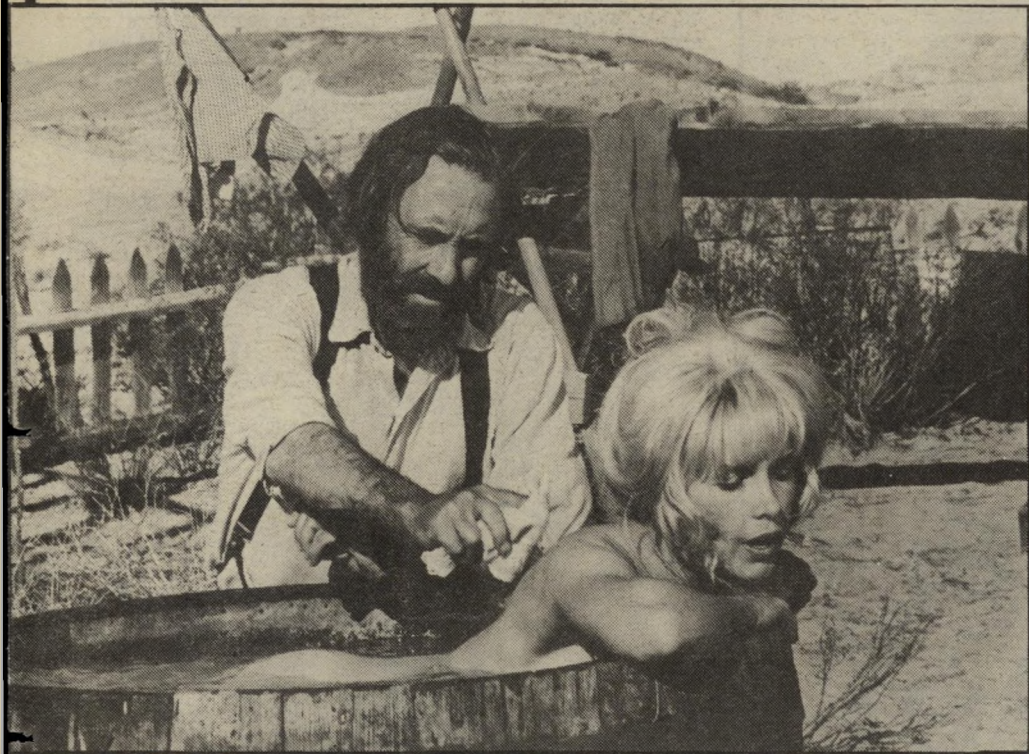
טילה סטיבנס הייבין רובאדס ס. באלאדה על קיבל הוג אמבט אחרון במערב הפרוע

כי בלב מירבר או שממה, הרחק מבתי המשפט. בעולם שרק מעטים בו יודו עים קראו וכתבו. אין ערך לקונסטיי הנקב של הכדור. מה הפלא שי דאסטין הופמן, שהופיע בסרטו, כלבי הקט כינה את פקינפה "אדם שחי מחוץ לתקופתו. אקדוחן בעידן ה"חלל"? אכן, נדמה כאילו כל גיבוריו היו