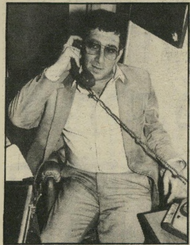
חבריועך ברון לחתיש את המנכ"ל

פתוחה: מי הפיץ את הידיעה שלא תהיינה מישכורות?