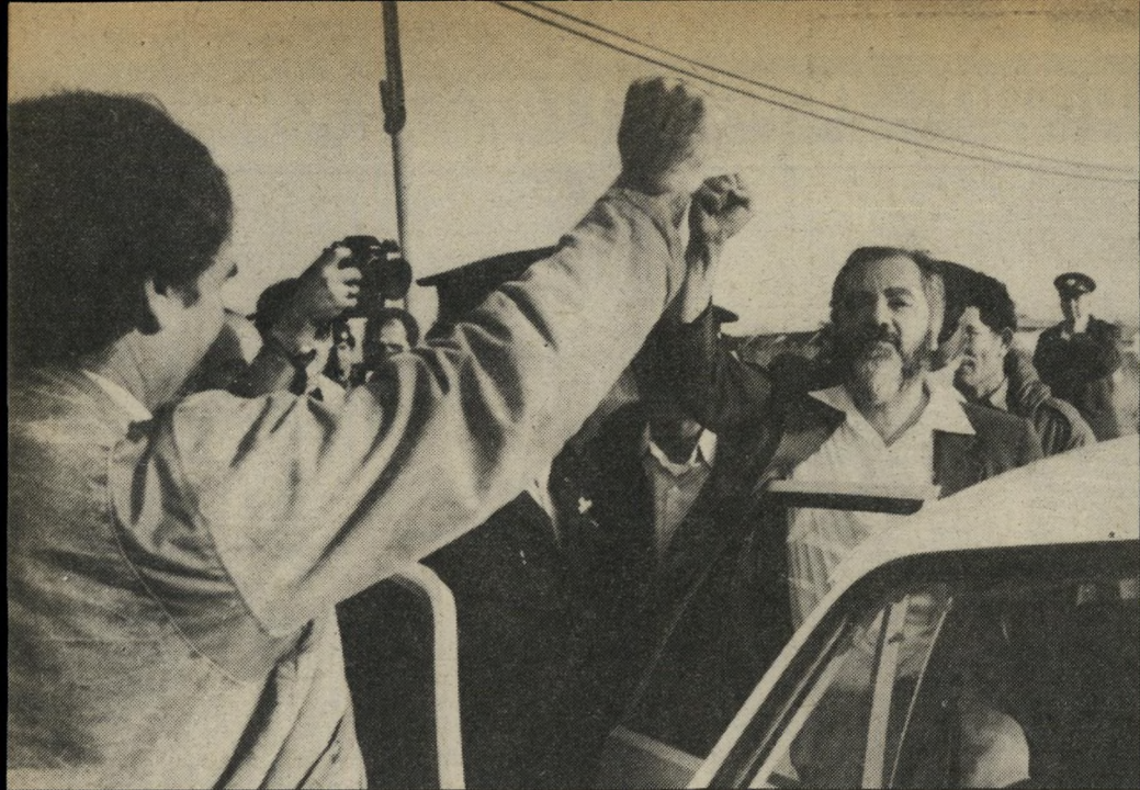
"הייל כהנא!" חסידיו של מנהיג כך. תלמידי בית־ספר יסודי ותיכון בחופשת חנוכה. מניפים ידיים וקוראים בקול: