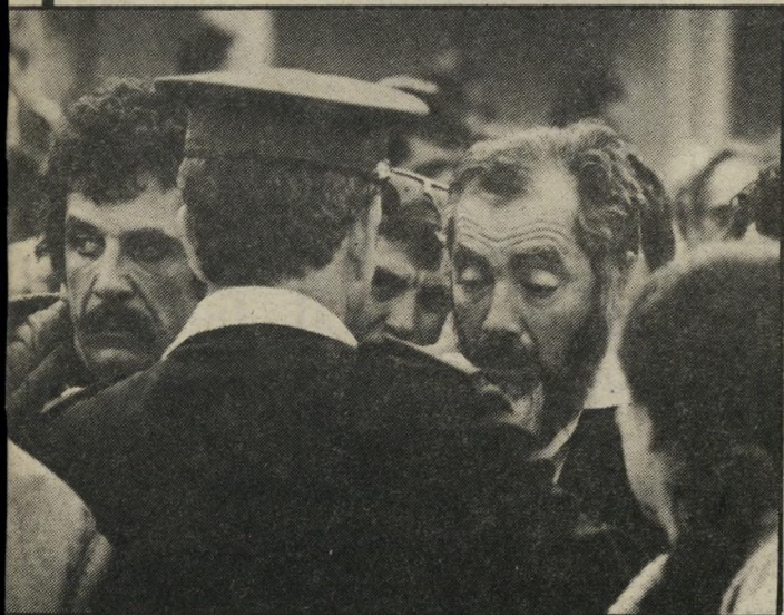
כהניסט מתחזה המישטרה שתלה ליד כהנא סוכן שכביכול שמר על הרב. כהנא היה בטוח שזה אוהד כפר־סבאי חדש.

"כהנא! כהנא!" לקבוצת הצעירים המוסתים האלה נילוו כמה מפעילי השרופים של מאיר כהנא המל" ויום אותו בכל ההפגנות והפעולות הפרובוקטיביות.