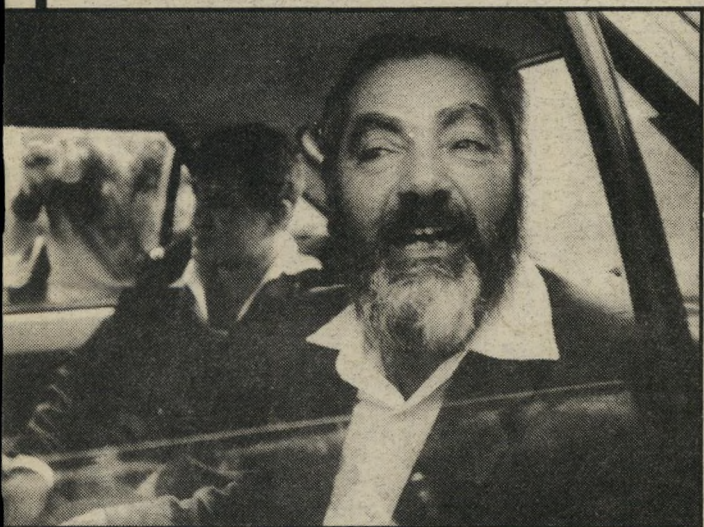
טרמפי הביתה מאיר כהנא שב לכפר־סבא במכונית המישטרה. אחרי שקיבל מסר חד־משמעי. שלא יוכל להיכנס לטייבה. מכפר־סבא המשיך השרץ לכפר־שלם.

לכרו בצומת. אלא לקחת אותו בטרמפי עד לרכב שלו. החסידים השוטים שלו הספיקו לגרף כמה מתושבי טייבה שבאו אף הם למחסום. לראות במרעיניהם את כהנא. אבל נהג האוטובוס היה מספיק הכם כדי למהר ולנסוע מהמקום. סמוך לשעה שלוש אחרי־הצהריים. שעתיים ויותר מאז הגיע הרב לתחנה המרכזית בכפר־סבא. יכלו עשרות אני שיהמיישטרה שגוייסו לצורך מיבצע עצירת כהנא להתרווח ולשוב לתהי נתימיישטרה שלהם.