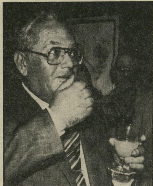
ח"כ ארצי נותר רק השלט

אחרים מבניין המיפלגה, הקסטל. בי רחוב אבן-גבירול בתל-אביב. המר מספר שאין לו שום רכוש נוי סף, וגם לא מניות שבהסדר. מכיוון שהיה שר, לא עסק כלל ברכישת מניות ואין לו, כדבריו, שום הון נזיל בכנסת. יש לו הסכונות עלישים כל אחד מיליון, בסך כמה עשרות אלפי שקלים.