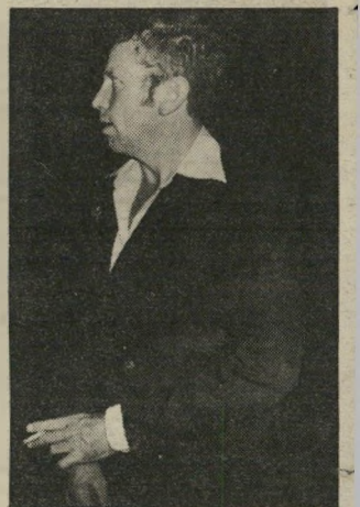
עיתונאי הלוי הסכם בין המוסד וטיים!

לפני ארבע שנים פירסם העיר לם הזה (8.10.80) במדור במדינה / עיתונות כתבה קצרה על הלוי, שעמד גם אז במרכז של שערוריה עיתונאית. הלוי ריווח ביומון האמריקאי ושינג' טון סטאר כי מנחם בגין הורה לראש