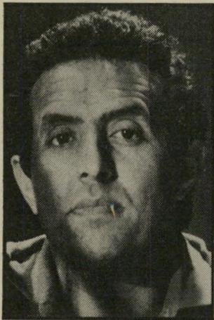
קורא בוחבוט יחס נאה וקורקטי

כדי לשמור על יחס נאה וקורקטי, נפגשתי עם הכתבת של העולם הזה, להבהיר את המצב לאשורו. התגובה שפורסמה (העולם הזה 5.12) אינה הזלמת ואינה עונה על הדברים שפורטו עליידי בשיחתנו, ואשר כאו להכחיש מכל וכל את הכתבה. כוונתי היתה, כי התגובה תפורסם, כוונתי היתה, כי התגובה תפורסם.