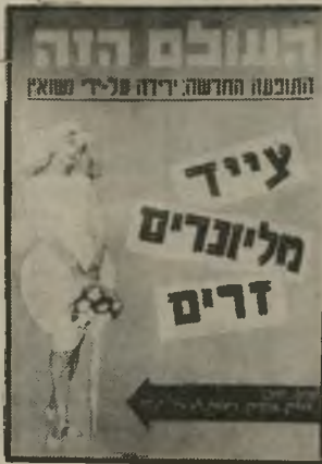
העולם הזה 1161 התאריך: 23.12.1959

חבריהכנסת ישבו דרוכים. מרוכץ הנואמים ירד דויד בן-גוריון שפוף, כשמינימחלה ניכרים בו. הוא מיהר לעזוב את האולם, בלי לשמוע את הוויי