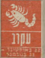
עקרב 21 באוקטובר - 20 בנובמבר