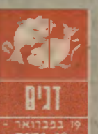
דגים 19 בפברואר - 20 במרץ