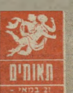
אדניים 21 במאי - 20 ביוני