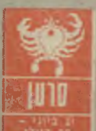
סרטן 21 ביולי - 20 באוגוסט