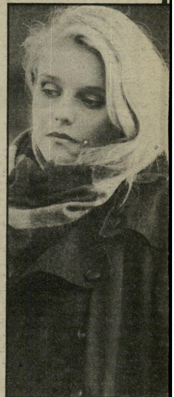
מיי בריט "היא התאהבה בישראל!"