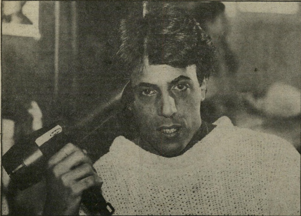
גמליאלי במיספרה "יצאתי מהיאושו!"