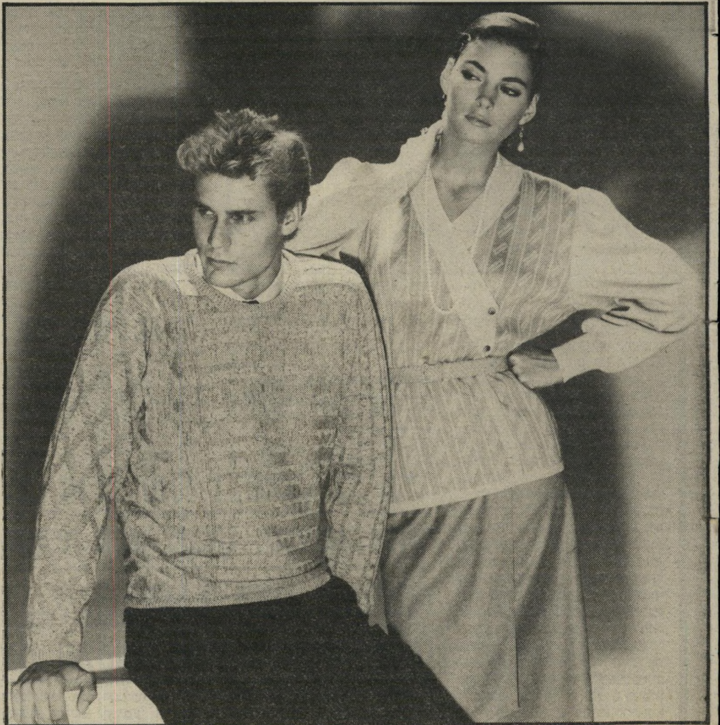
כבשים טהור, מועשר בחוטים מבריקים. יצירה של חותם-הצמר, מועצת הצמר הבינלאומית, שמרכזה באנגליה ובה צוות מאנגליה, איטליה, הולנד ויפאן.