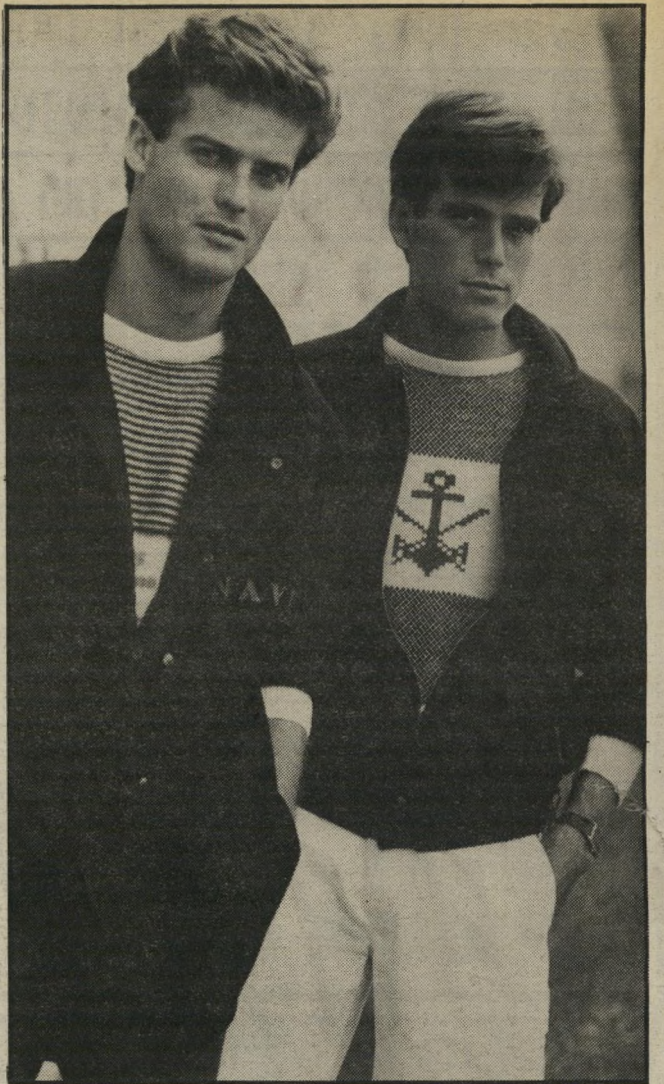
ספורטיבי ז'אקט-צמר בסיגנון הבלוזון, הנרכס ברוכסן, וז'אקט-צמר באורך 3/4, הנרכס בניטים, בגווני כחול חיל-הים. מתחתי: סוודר בכחול-לבן, במוטיבים ימיים. המיכנסיים לבנים.

גדרל ושמוט. מעצבת האופנה אתי קרון מעצבת בגדים במראה צעיר, בסיגנון צרפתי-איטלקי, קצת זרוק, אך עם הרבה שיק, קרן מבקרת לעיתים תכופות באירופה, שואבת רעיונות והשראה, חוזרת ארצה ומממשת אותם.