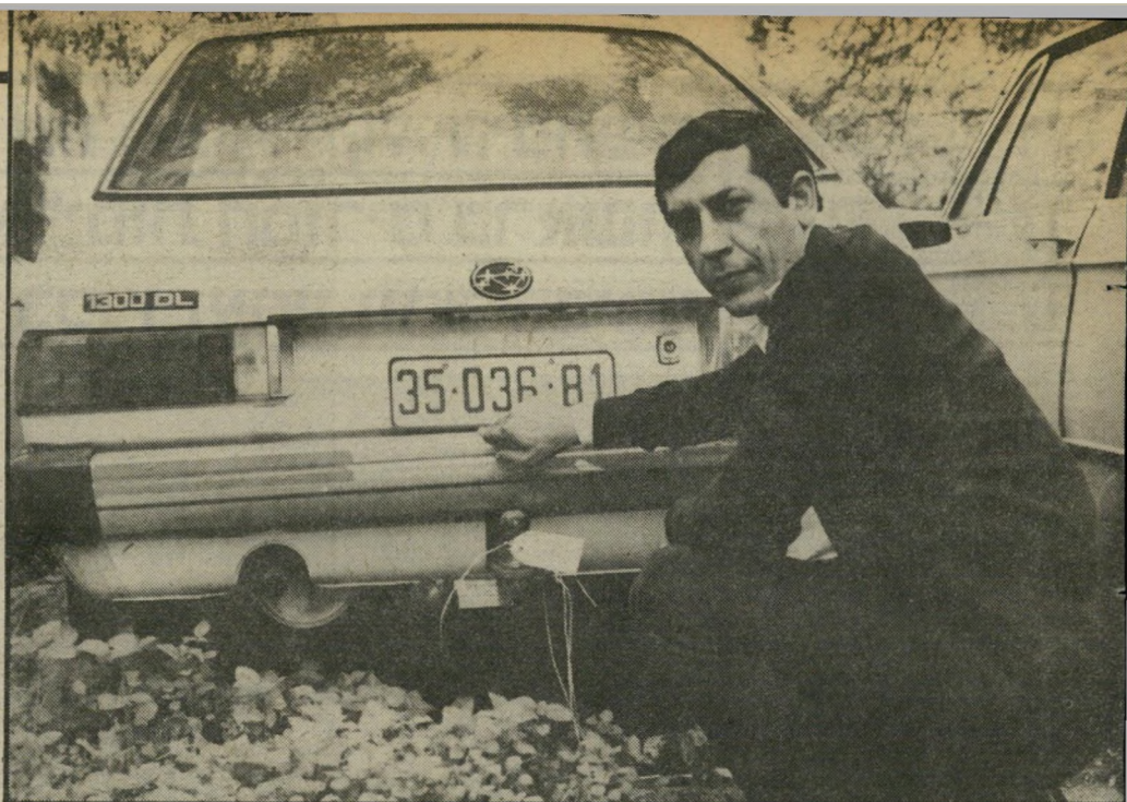
טיפת דם בתא-המיטען שנמצאה במכוניתו של עורך-הדין שימעון חרמון, הובילה כבר בראשית החקירה להחשדתו של עורך-הדין. בתצלום: מקד חרד מצביע על תא-המיטען של מכונית ה"סובארו" של שימעון חרמון, החתומה בחותמת בית-המישפט.

שבעת הטיוול הציע לה חרמון להישאר באירופה ולהתחתן. ואז חזר חרד לחרמון. זה נקט, בשלבים מסויימים של החקירה, בשיטת השתיקה. הוא בחר לשמור על זכות-השתיקה. הוא לא רצה להתייחס למימצאים שחרד הציג לו. חרד לא התעצבן. המשיך בעבודת-הנמלים. לא התעלם משום פרט. חרמון טען שהוא עקר, ולכן אין אפשרות ביולוגית שהוא אבי העובר. הוא גם היפנה את חרד לחקור את הפרופסור שטיפל בו. זה בדיוק מה שחרד עשה. הפרופסור לא אישר את טענת חרמון. בשעות החקירה הארוכות שוחחו על נושאים שונים ומשונים. כולל התחביבים של חרמון — שיט בכנתר וטיולי קמפינג. ואם כי, לדעת חרד, היה בניניהם כבוד הדדי — הם לחצו ידיים בכל פעם שנפגשו — היתה לחדר הרגשה שזה צבוע ולא אמיתי. תוך כדי שיחה עניינית אמר לו חרמון פעם: "אתה ערבי חכם. ואני יהודי לא טיפשי". תיק חרמון הוא אולי התיק הקשה שהיה אייפעם בידיו של מישל חרד. אבל גם תיקים שפיתרונם קל בהרבה מסעירים לפעמים את המדינה. אחד מהם היה הרצח המשולש ברמת-אביב, שבו נרצחה אביה פפושדו.