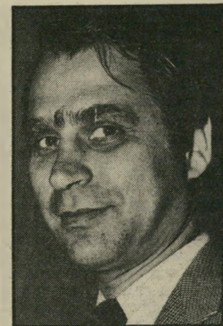
מתמודד מוז מכונית ונהג