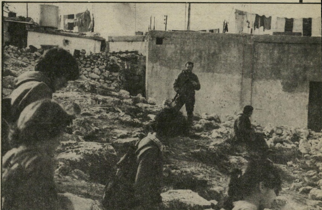
חיה ליד דהיישה (בתמונה) כדי למנוע עימות. בתמונה משמאל: הטיול בכפר ארטס, ליד בריכות שלמה. בתמונה העליונה: חייל צופה אל דהיישה.