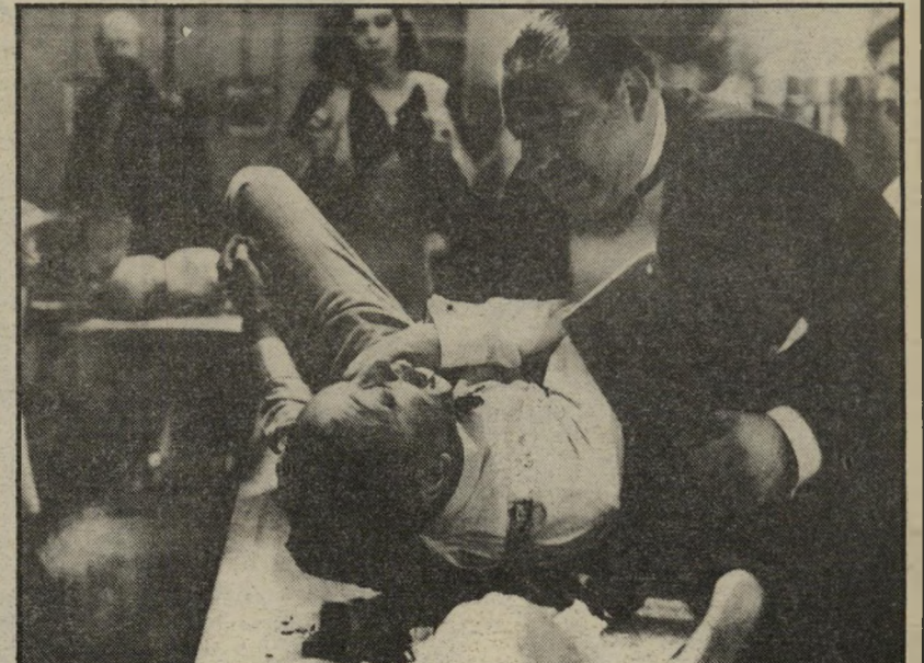
סנין ביד אלימות גורת אלימות, קינאה ונקמה. אחד מאנשיו של המאפינור דאץ' שולץ מנסה לרצוח גאנגסטר יריב מכנופיה מתחרה באמצעות סנין. על גבי אחד משולחנות המועדון המפואר (בו צמחו והתפתחו נגני ג'ז גדולים ונוודעים).