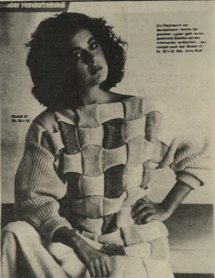
Hier sind die neuen Pullis Die Natürlichen

Ein Plaidrock von Melisandre? Welche der gleichen Luster ganz rechte geometrische Linien werden miteinander verbunden das klangen durch die Moden 81 Gr. 38 + 42 Mai Arny Blatt