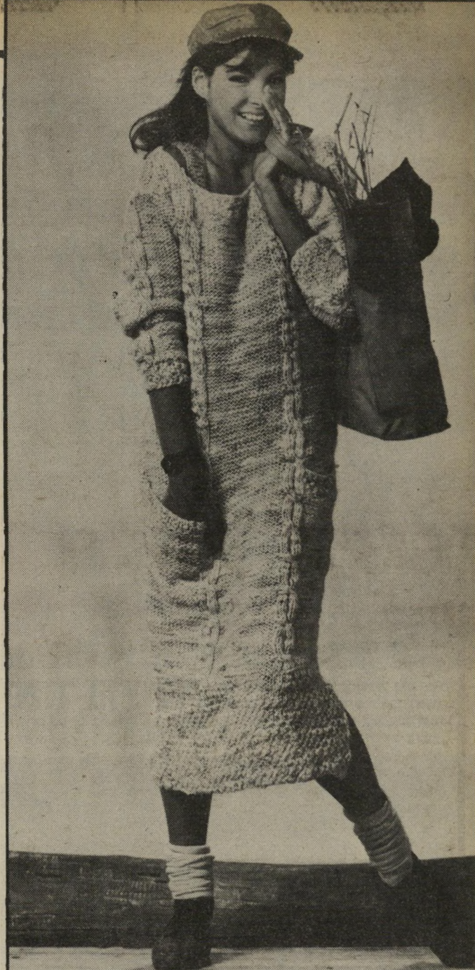
סוודר מוארך ההופך לשימלה. אם יש סוודר שנסרג ביד ורוצים לחדשו ולרעננו. אפשר להפכו לשימלה. עלידי כך שמתירים את אימתו וממשיכים לסרוג עד מתחת לברך.

אפשר גם אחרת. לא חייבים לקנות — אפשר גם לשפץ, לרענן, לשנות, ולחדש את הבגד בעזרת שתי ידיים, ראש חושב, רצון טוב ומיגוון רב של פאטש'ים. למי אין בארון בגדים מן השנה שעברה או משנים קודמות, בגדים שהם עדיין טובים ושלא לובשים אותם?