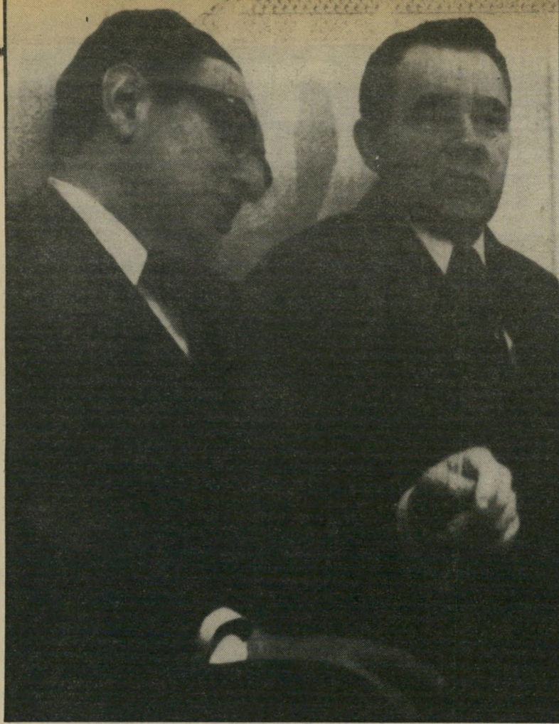
גרומיקו וקיסניגר נועדים בעת הוועידה פעמוני האזעקה פעלו

ברגע זה מקובל העניין על ברית המועצות, מזכירות האו"ם, ירדן ואש"ף. קצת פחות מקובל על אירוסה המערבית, מצררים וסוריה. מתנגדות לו בהרסות ישראל וארצות הברית.