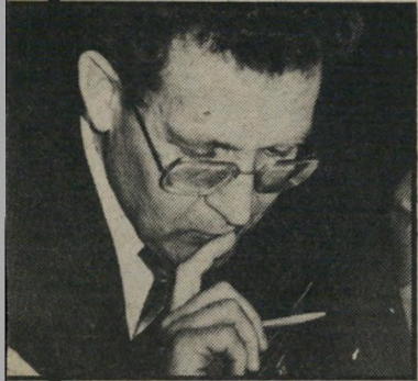
ח"כ זייגר פרדס בראשון-לציון