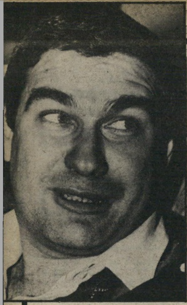
ח"כ רמון דירה ברמת-השרון