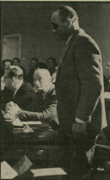
על הרגליים, על הראש שריי שלה החדשה היו בשבוע הסתיו החמים של סוף נובמבר 1959 בחדשות. חברי-הכנסת הטרי משה דיין