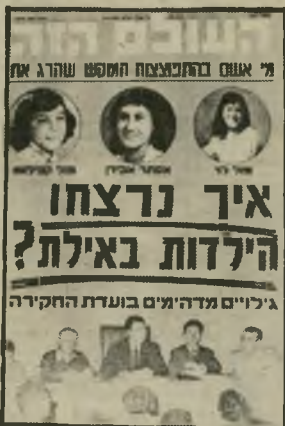
העולם הזה 1158 תאריך: 2.12.1959