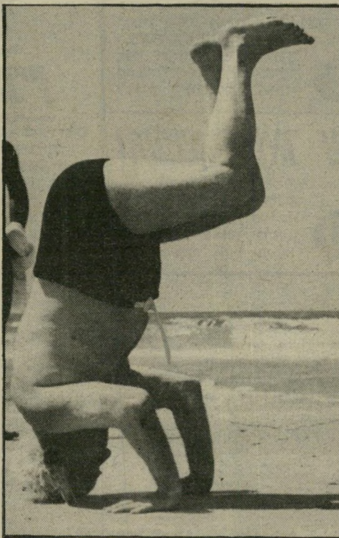
עמד על רגליו. מכורסתו שליד שולחן-הממשלה בכניסת, ונשבע אמונים כשר-החקלאות. ראש-הממשלה הוותיק, דויד בן-גוריון, לעומת זאת, ניצל את מזג האוויר והדגים לכל את עמידת-הראש שלו.