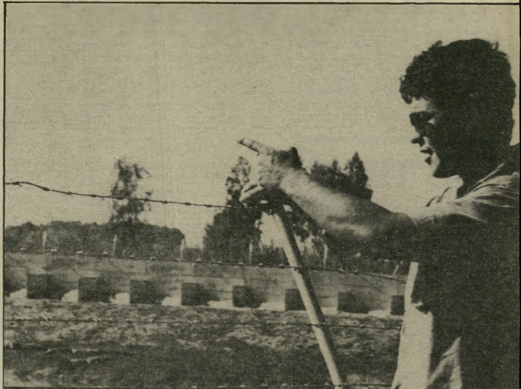
כך תנינה נזקקת לתא המיועד לה בלבד, שרופד בחול רך, וכבר עכשוו הפך המקום לאטרקציה גדולה לחברי גן-שמואל (משמאל). שבאו בשבת האחרונה.