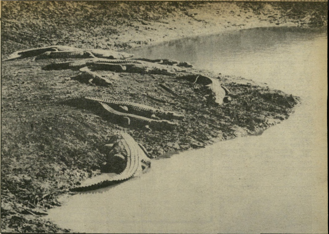
בריכות בעומק שני מטר, עם מפוצים, שבהן שורצים 210 התנינים. אשר הובאו לפני שבועיים לארץ. רק בשבוע שעבר קיבלו תנינים. האוכלים רק אחת לשבועיים. את מזונם בשיכונם החדש בקיבוץ גן-שמואל שבשומרון.