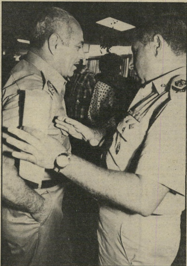
ניצבים תורגמן וקראום שני הפטרונים של שני המחנות

פרשה מפורסמת. שהציבור נדהם לשמוע אודותיה, היתה הפרשה של