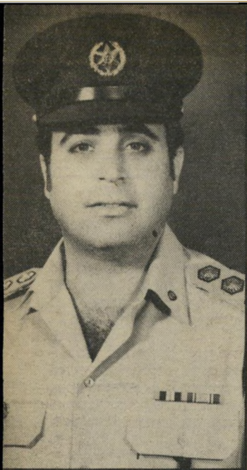
סגניניצב אנקורי מילחמת סמכויות