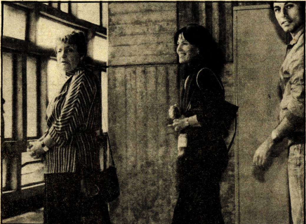
נגדו. ולמרות הכל היא עומדת כיום לצידו. היא באה לכל ישיבה של בית-המישפט ומחייכת באומץ-רוח. בעלה צפוי, אם יורשע, לעונש חמור ולשלילת רישונו.