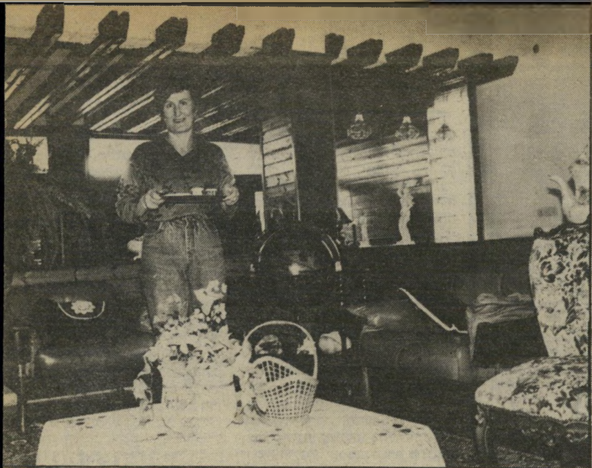
אם הנאשם בביתה זו היתה שנת-ג'הינוס"

מסכת טעויות המישטרה נמשכה גם בבדיקת האליבי של אותו בחור. הבחור החשוד טען שבשעת הרצח הוא שהה עם אמו ואחותו אצל רופאי-שניים בטייבה. בבדיקה שערכנו התברר לנו, שלמחרת הרצח הגיעה אמו של הבחור לרר פא וביקשה שישקר ושיאשר שאכן היא היתה עם בנה אצלו. הרופא סירב, והאליבי הופרך. עד כאן דבריו של הסניגור, שרעבי.