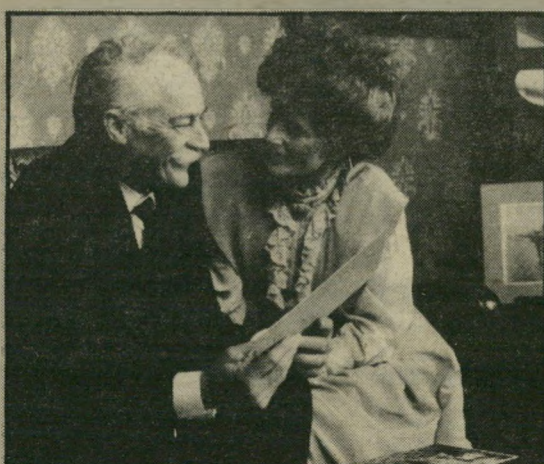
פארנסוורת וג'קי בורסוס - בלי גינוני טקס

שנית, על-ידי שילוב קיסעי מערבונים ישנים, החל משוד הרכבות הגדול והלאה, עורך הסרט השוואה בלתי-מוסקת בין מה שקרה עובדתית, לדרכים שבהן העובדה הזאת הופכת למעשי-גבורה קולנועיים, ובכך יש לסרט הזה מרכיב שאין מוצאים, לרוב, במערבונים, ובודאי שלא במערבונים קנדיים.