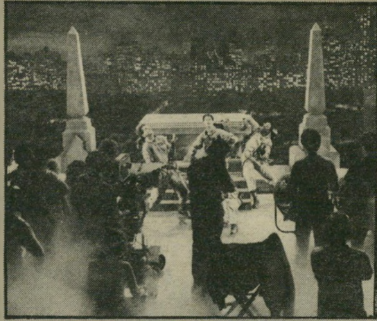
מארי אייקרויד וראמיס - מכסחים על הגג

עיקר העלילה עוסק במאבק של השלישייה הזאת עם הרוחות שבמקרה של סיגורני ויבר, העוברים אחר-כך למיקדש שהס-תתר על גג גורד-השחקים שבו היא מתגוררת, וכאילו לא די בכך, הם צריכים לחסל את גורד האיים. הרוח הרעה שבאה מארס-נהריים לגדות ההאדסון. הם צריכים גם לסתום את פיהם של אקולוגים למיניהם, הטוענים כי הם מפירים את