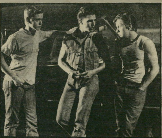
תומאס האול, תום קרוז ואמיליו אסטבטס רצינית.

קפולה מביים את הסיפור כאילו הוא מתייחס אליו במלוא הרצינות, ומלווה אותו בכל מיני תרגילי-צילום מיותרים בהחלט, וניסיונות לפיות קולנועי שהיו שגורים אולי בשנות השלושים, אומנם, להקת הנערים המופיעה אצלו הצמיחה כמה מן האלימים החדשים של הוליווד, כמו מאט דילון, טום קרוז או ראלף מאקו (שמופיע בימים אלה על בדי הארץ גם כנער הקאראטה), אבל קשה לומר שתרומתם בסרט הזה היא