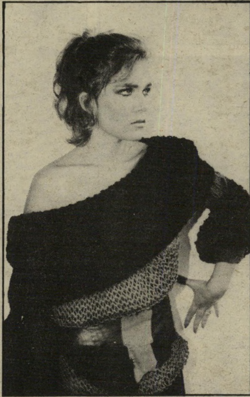
הסריגה - מחוררת, הצווארון - שאל ענק ומיוחד, ההופך בימים קרירים לכובע קפישון מחמם. הצמר - תוצרת הארץ. אפשר להשתמש גם בשאריות.