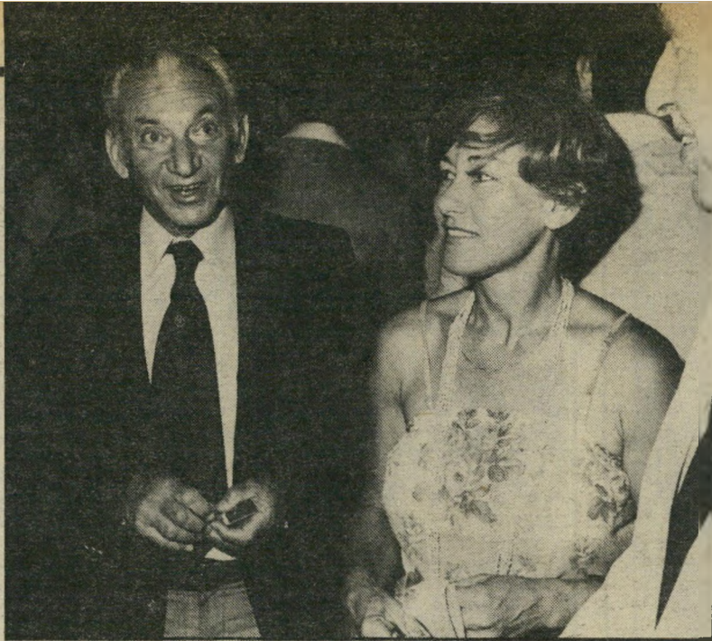
תמר וחיים ברילב במישטרה הקידום הוא איטי?

נפטר ♦ בלונדון, בגיל 81, ישראל סומן, יהודי יליד דרום-אפריקה, יליד קרוב של נשיאה הראשון של קניה, ג'ומו קניאטה, אשר מינה את סומן ליו"ר הראשון של מועצת ייצור ושיווק הבשר של קניה ולאחר מכן לשתי קאדני-ציות כראש העיריה של נייורובי, בירת קניה. כמשך 14 השנים שבין הקמת מדינת ישראל למתן העצמאות למושבות בריטניה בישראל אפריקה (לקניה), טנזניה ואוגנדה של היום) גם שימש סומן כקונסול-הכבוד של ישראל במיורח אפריקה.