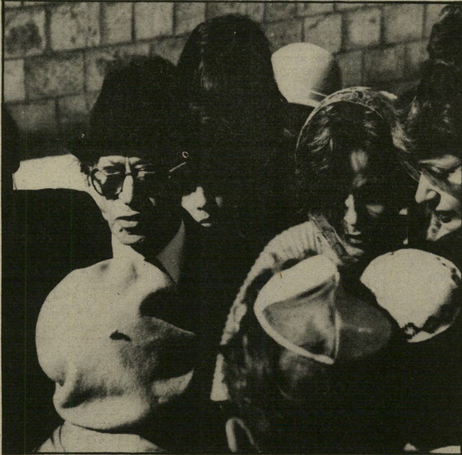
אנחם בגין באזכרה במלאת שנתיים למותה של עליזה בגין. אשתו. בגין הופיע לאזכרה כשהוא נתמך ומלווה על-ידי בני מישפחתו. הוא לא הוציא כמעט מילה ממנו במשך כל הטקס הדתי. בסוף הטקס הוא עבר בין שתי שורות הקהל הרב שנכח במקום, רובם חברי אצ"ל לשעבר, ולחץ את ידיהם כשהוא מעלה חיוך רפה על שפתיו. בגין נראה רזה מאוד וחיוור, ובקושי צעד על רגליו. אנשי-הביטחון ובנותיו תמכו בו בזרועותיו, כדי שיוכל לרדת את המדרגות התולדות של בית-הקברות.

■ גם היעדרו הכרוני של ח"כ אהרון אברהצירא מהכנסת