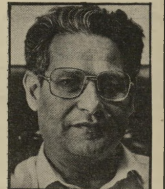
מנביל ברון כדאי להיות ידוד