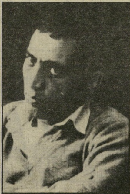
ח"כ ביטון להט ותעודות