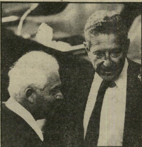
ח"כ פלר (ליד השר וייצמן) נשמע כאיש מאמין