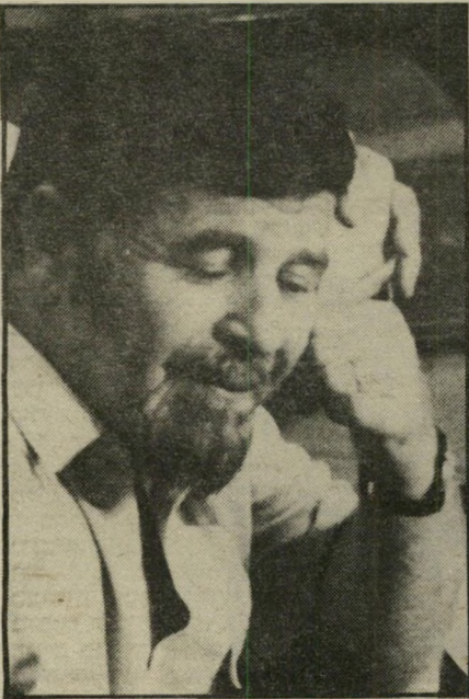
ח"כ ויים לשבת ולעבוד