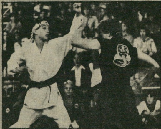
ראלף מאקיו: החלש מנצח

יתיה זה מוגזם לומר שהסרט מרתק או עוצר-נשימה, כי הרי מן הרגע שמוזהים את הנוסחה, כל צעד נוסף ברור מראש והשאלה היא רק כמה זמן יקח עד שהגיבור, הנתון במצב נחות, יגבר על אויביו העדיפים. הקהל, המצדד תמיד בחלשים,