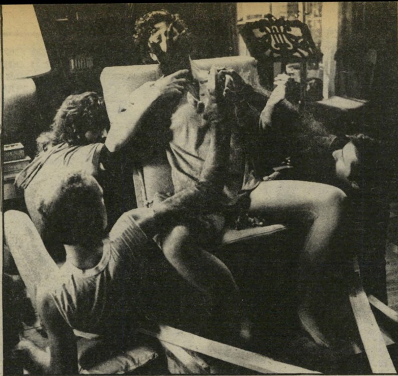
סיגורני ויבר מותקפת על-ידי טלסיו של כלב ענק בסרט. גוסטבאסטרס" הטלפיים הן כפפות על ידי הפעלולים