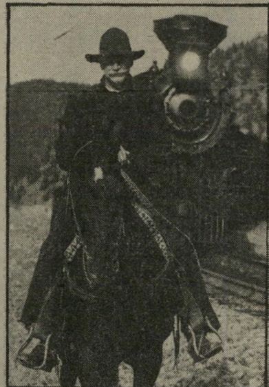
פארנסוורת' בתפקיד ביל מיינר ביזבו כסף ואהב לשיר

כימנים כחולים. מה שהייתי רוצה לעשות הוא סרט על שנות חייו האחרונות של וייט ארפ. אותו גיבור אנדתי של המערב הפרוע, שהתפרסם בדריקרב בארץ קוראל. יש לי תסריט ואני