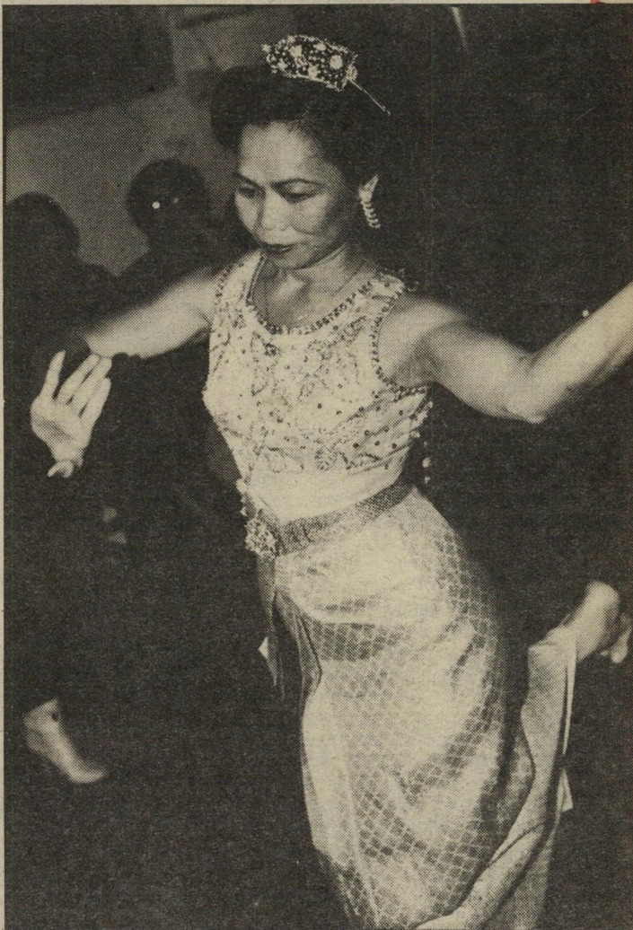
סוי סומסי רקדנית העובדת במיסעדה תאילנדית. מופיעה לכבוד הברדן הממלא את אולם היכל התרבות. בעל המיסעדה, בון, החליט להאכיל את טופז באוכל שהכין במו-ידיו: איסריות תוצרת-בית. בון גם התעקש להאכיל את טופז במקלות סיניים.

פליטת פה - זה שמה של התוכנית של הברדן שפלט במיקרה את המילה "צ'חצ'חים", בבחירות של 1981. מאז רדף הכינוי הזה אחרי דודו טופז. היום הוא משתמש בפליטות-פה מתוכננות, במופע שממלא את היכל התרבות מדי חודש בחודשו. טופז חגג השבוע את ההופעה ה-150 של פליטת פה. אין ספק, שהוא גורף הון רב מפליטות-הפה האלה. הקהל צוחק ודודו מתעשר. ולכבוד כך חגג טופז השבוע במיסעדה תאילנדית בצפון תל-אביב. בעל המקום, בון, הכין לו הפתעה - רקדנים ורקדניות תאילנדיים. לפני שכולם טרפו את המזון הרב שהכין בון, הופיעו הרקדנים לצלילי מוסיקה תאילנדית.