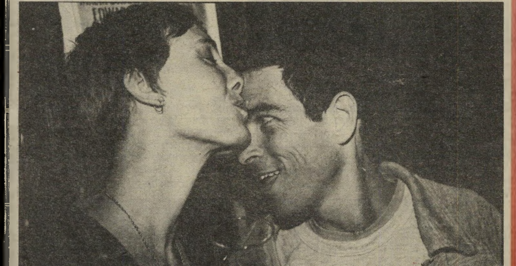
הקטנה. שימשוני מוכר לצופי סידרת הטלוויזיה אנשים במיל. בהצגה באפלו אמריקאי הוא משחק את הילד שהעולם התחתון משתמש בו. הוא גם שיחק בסרטים ישראלים רבים בתפקידי חיילים

באפלו אמריקאי הוא שמה של ההצגה שתירגמה טל רובינשטיין, בתו של שרי-התיקשורת אמנון רובינשטיין (הפעם ממשלה עם שיר נוי). לבכורה באו שרי ישראל: שר