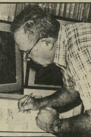
מתנדב זרע הסגן היה לאלוף

"בעזרת הפריץ". הציל את המ צב הפרופסור שימעון שמיר. שבילה שנים אחדות במצריים, שסקר את יחסי ישראל עם המדינה הערבית הגדולה ביותר. שמיר האשים בגלוי את ראשי