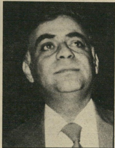
מוזעמד צמה אפשות

הנושא של מנהל הטלוויזיה אינו יורד מהפרק (ראה הנדון). השבוע, כשחזרו חברי הוועד