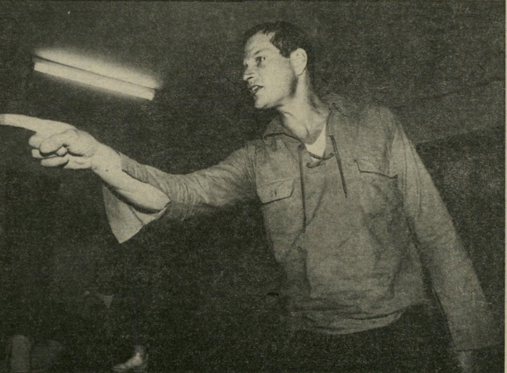
אייל: "היה יכול להיות קרב אמיתי... יכלו ליהרג אנשים!"

איש אינו נענה לפקודתו. הקפטן ניגש למלאכה לבדו. מגיע לכושי ומתחיל להצליף עליו בחבל עם ראש תורכי בקצהו. ולהרביץ את ראשו בכדור. בשלב זה התערבו שני מכרי