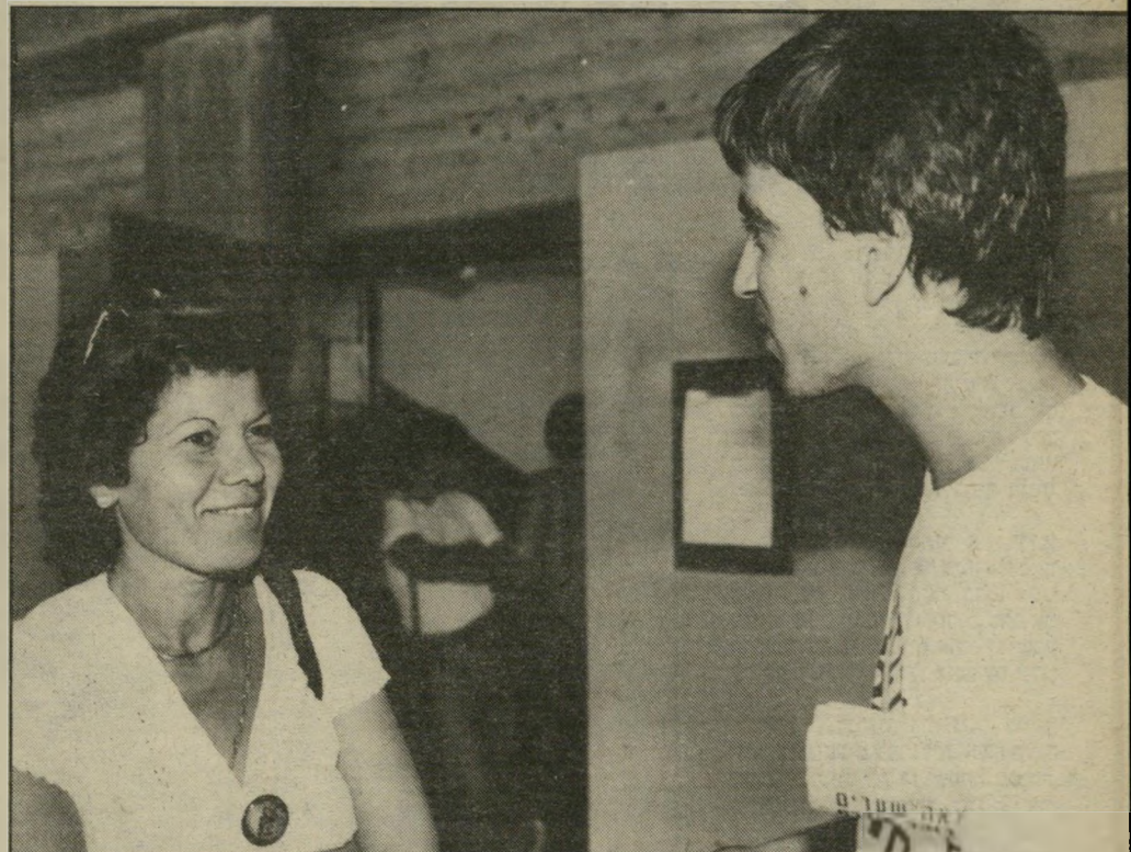
אחיו של הנאשם עם גרושת הנרצח בשיחה ידידותית בבית-המיטשפטי אלבי בתחנת-הטוטו