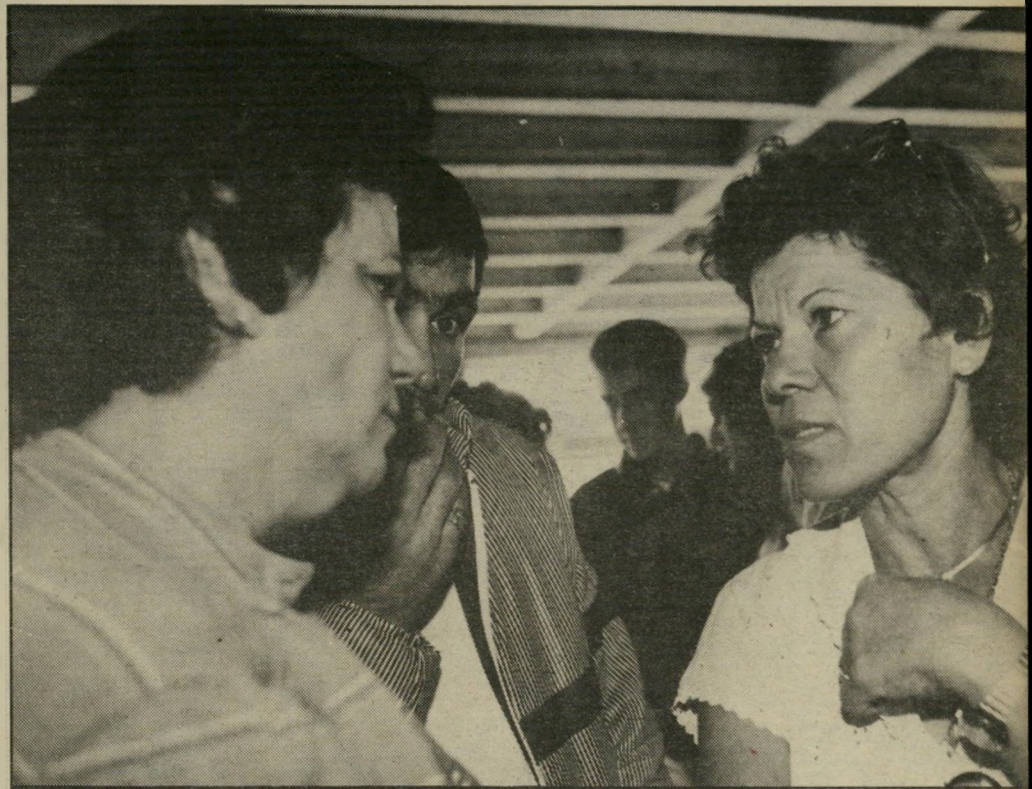
גרושתו של הנרצח (מימין) עם אחותו בבית-המיטשפטי. גט כדי להעניש ולחזור."