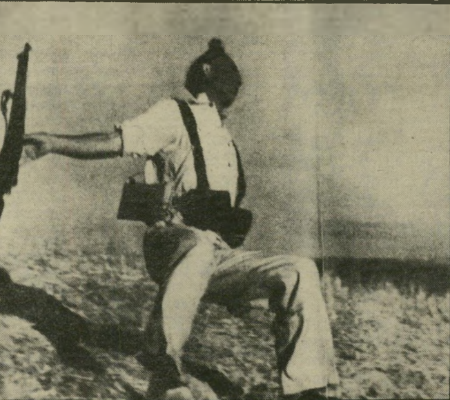
התצלום של קאפא: לוחם חרות ספרדי קורס מפגיעת כדור בחלקיק השניה, ברומו של עולם

לא הבנתי את טיב המידע על המשורר אבות ישורון, עליו כתבתם לרגל יום-הולדתו ה-80, כי הוא מרבה להשתמש בתנועת הקובוצ. מה זאת