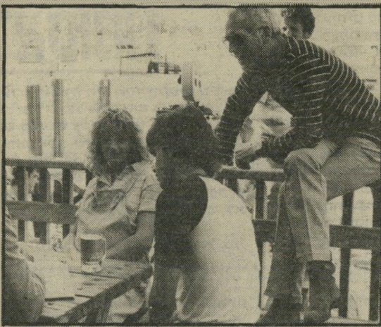
פול ניומן: האב מת על פני בנו

צריך לומר, שבסרט מערכת-היחסים היא המוכה מזו שהיתה, בחיים. כי מדובר באב אשר היה כל חייו איש פעיל ומלא מרץ, אשר נותר ללא עבודה אחרי שמתגלה פגם בליבו, ובניחים שבין אב זה לבנו, עזיר החולם להיות סופר, ובניתיים מסתפק בעבודות דחק המתירות בידיו די פנאי כדאי לבלות עם ידידים על שפת-הים ולכתוב את סיפוריו, המוחזרים על-ידי המו"לים באותו הקצב שהוא שולח אותם. האב, שחוסר-הפעילות מחבל בשינוי-מישקלו הנמשי, כועס על הבן ההולך בטל, לטעמו, והבן עושה כמיטב יכולתו לספק את רצון האב שהוא מעריץ. דמותה של אם, אשר הלכה לעולמה לפני זמן קצר, אינה מניחה לאיש המבוגר כל התקשרות רגשית אחרת, גם לא עם ידידה טובה, בעלת חנות לבעלי-חיים, שבתה קשורה מאוד לבנו. במהלך הסרט נוצרים יחסים מוזרים, שבהם חוסה הבן על האב ואומר דברים שכנראה אמר ניומן, בחיים, לבנו שלו: מעין