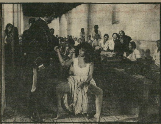
גזליה מינגס-ג'ונסון: האהבה והמוות

פראנצ'סקו רוזי, מגדולי הבימאים היום בעולם, נטל את יצירתו של ז'ורז' ביזה, שעליה אמר ניצה, כי אלוהים צועד בה בצעדי-נער, החזיר אותה מן הבימה אל אנדלוסיה. הפיח בה רוח-חיים חדשה בעזרת הנופים המקוריים, הרקדנים של אנטוניו גאדס, ומצלמה אשר תמיד יודעת להתמקם, באורח פלא, במקום הנכון. כדי להעניק לסוג זה של אמנות - שהוא אולי הכפוי והעמוס ביותר במסכמות מכל אמנויות הבימה - טיבעיות רעננה וריאליסטיות. מעבר לכך, עורך רוזי השוואה בין דמותה הגאה והבלתי-מתפשרת של הצועניה, אשר בוחרת את מאהביה ומשליכה אותם רק לפי צויליבה וללא שום נגיעה לפחד או למוסר, אל הפר בזירת מילחמת-הפרים. שתי המעלות העיקריות של הסרט הזה הם גזליה מינגס-ג'ונסון, שאולי אינה הגדולה בזמרות-תבל, אבל היא ללא ספק היחידה בין הזמרות המסוגלות להתמודד עם תפקידה של כרמן, מבחינה קולית, אשר ניחנה בחושניות, בחיוניות ובעזות-היבטיו הדרושה לתפקיד. שלא לדבר על צורת חיצוניתה שאינה מזכירה בשום פנים ואופן זמרת אופרה