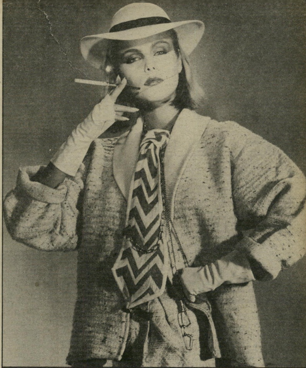
בשילוב עניבה סרוגה ורחבה, בגוויני בז' וחוסי. אביזרים נוספים: כובע, כפפות ושרשרת זהב או מוזהבת. את העניבה אפשר לשאול מהבעל, או מהמאהב.