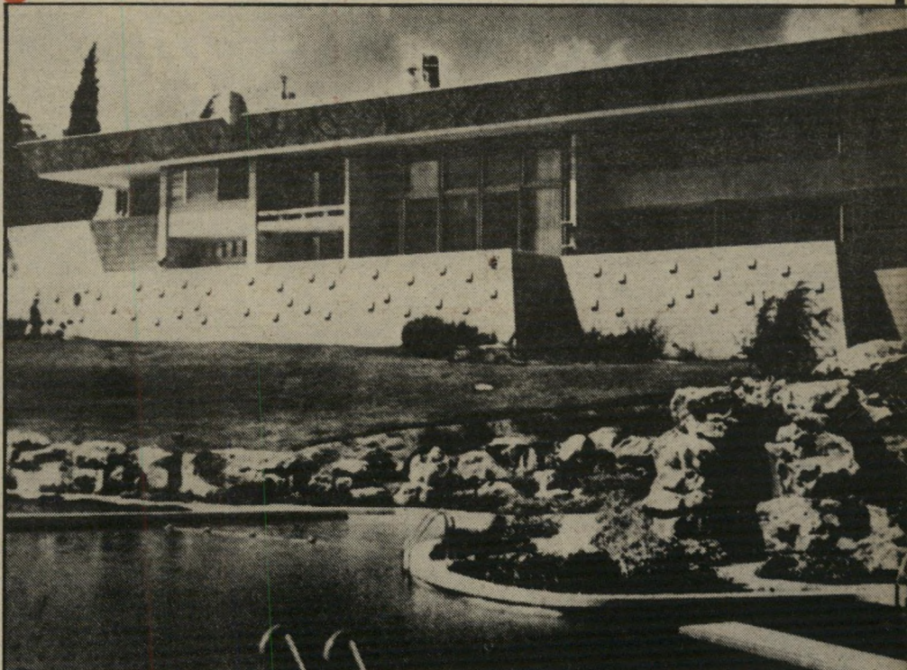
סלון גדול וקטן, חדרי-אוכל גדול וקטן, חמישה חדרי-שינה עם חדרי-אמבטיה צמודים, ובשעתו גם היתה לו בריכת-השחיה המחוממת הגדולה בארץ.

למרות שהיתה לי אומנת, לא היה שום ביכוח בבית. היו קונים לנו חולצות עם כפל, וכשגדלנו פתחו את התפר. עד עכשיו אני משוכנעת שבורגנים אמיתיים לא מבזבזים מי שמבזבז, אלה הנובורישים. הייתי מיפלצת איזמה, עם טמפר מנט בלתי-נסבל. למדתי נגינה על הפסנתר. לא הייתי מוכשרת. המורה דרשה, כשיעור אחד, לתרגל רק