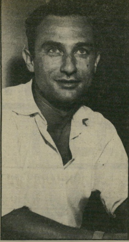
מזוכה שטמפפר שישה אנשי-צוות נעלמו בים