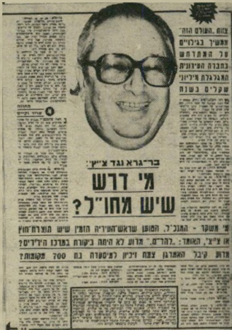
"העולם הזה" 19.1.83 ומתי?

השבוע מכתבת-הפטרות. כן-גרא טען שההמלצות של ועדה, שמינה להט כדי לחקור עניינים שונים הקשורים במרכז-הירידיים, גרמו לשפית-דמו על לא עוול בכפו. הוא האשים בכך את "הפוליטיקאים". אמר צ'יץ: "הפוליטיקאים במרכז הירידיים אשמים בכך שהניחו לו לע-שות מה שרצה כירידי. הם היו צריכים לשתות את דמו מוקדם יותר. הם התחשבו בו, ויתרו לו, והוא עשה את שלו. מבחינתי זוהי שערורייה "בינלאומית" ראש-העירייה הוסיף שהוא יודע כבר מזה כמה חודשים על "החריקות", דבריו, במרכז הירידיים, אך שהחליט לדחות את טיפולו בעניין בגלל הבחי-רות לכנסת. הוא גם הגדיר את המנכ"ל כמי ש-אינו יכול לעבוד בחברה צי-בורית, מאחר שהקריטריונים של העולם הזה 2461