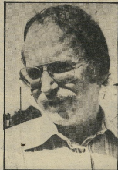
אלדר שרון שלוש נשים -

הוריו בנו בית דרקומתי ברחוב הירקון. בקור