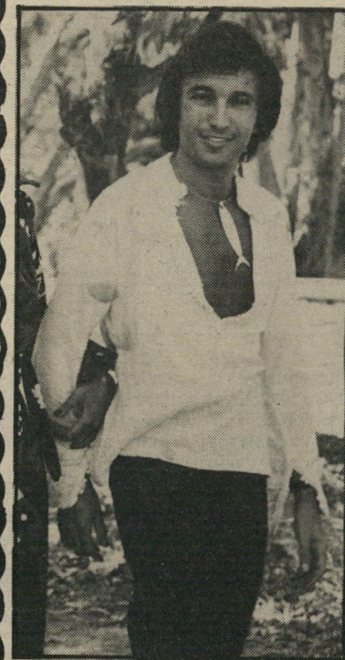
איב דהימרדיקס גירושין בשקט

רומן עם השחקנית הישראלית חנה עדן. כבוטיק שלו ישבה ותפרה דליה, המבוגרת בכמה שנים ממנו. היא אהבה את הבוס שלה וקינאה לו. הנאמנות נשארה פרי, והזוג התחתן. הנשואין לא החזיקו מעמד. דליה הפסיקה לתפור והחלה עובדת כמנהלת-העסק. השבוע נודע על הפרידה ובקשת הגירושין.