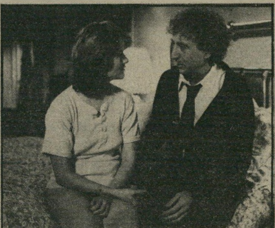
ג'ין ויילדר וג'ודית אייבי: בין גיחוך להיסטריה

להבדיל מן החן האלגנטי של ז'אן רושפור, שגילם את אותה הדמות בסרט של איו רובר, הופך ויילדר את השלומיאליות העצבנית למעלה עליונה, בוחר במשהו שבין גיחוך להיסטריה כקו התנהגות נורמלית. מכאן והלאה שום דבר לא יכול להציל את הסרט, בוודאי שלא חבריו (בסרט הצרפתי היתה הידידות הגברית אחד המרכיבים החשובים ביותר), שהם במיקרה הטוב ביותר צללים חיוורים.