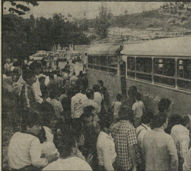
האוטובוס הפגוע כך נראה האוטובוס הפגוע. נוסעיו מתגודדים סביבו, מייד אחרי שהטיל מסוג לאו חדר פנימה והרג נוסע אחד ופצע עשרה נוסעים אחרים.

מרבית כשם עצמי, לא יכולה לדבר כשם אחרים, למרות שאני מאמינה שהרבה חושבים כמוני! נאום השכנה. האם מביטה בשכנה בעיניים פעורות. היא מקשיבה, כמו מחפשת דבר להיאחו בו, כמו רוצה שמישהו יתן לה צידוק למעשה הנורא שבו נחשד בנה, כמו בונה לעצמה את האירוי אולוגיה אחרי המעשה.