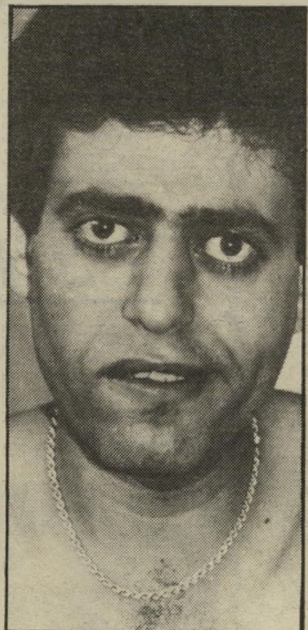
זמר תבורי גם להסתבך וגם להתחכך

אבל כבר אז היה ארבר בעיצומה של חינתג-שתיה יום-יומית. עברנו יום ולילה, וחשבתי שכוסית תשפר את