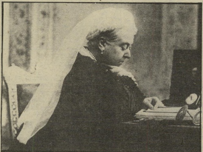
המלכה ויקטוריה 23.100 דולר

נחוג בניו-יורק, יוסי-הולדתו ה-35 של בנימין (ביבי) נתניהו, השגריר-הצביר הראשון של ישראל לאו"ם, אחד משלושת בניו של הייסט (טורין בן-ציון נתניהו (מעורכי האנ-ציקלופדיה העברית, השוהה זה שנים בארצות-הברית, שם הוא משלים את ממשות הכרכים שלו על תולדות יהודי ספרד בימי-הביניים). נתניהו, ששרת בצה"ל חמש שנים קבע (וכסרן בסניירת עילית) הוא בעל השכלה של אדריכל ומנהל-עסקים, היה פקיד בכיר במפעל תעשייה ירושלמי (הרייטריס), שממנו