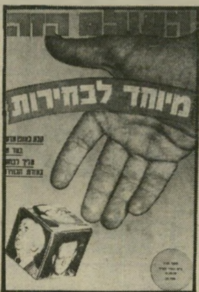
"העולם הזה" 1153 תאריך: 31.10.1959

בגליון. העולם הזה, השבוע לפני 25 שנה, הגישה הכתבה המרכזית, חידון בחירות 1959, אשרות כמעט-מדעית לקבוע את הרשימה שעבורה יצביע הקורא, לפי התשובות שיתן על 20 שאלות, שעמדו ברומן של עולם לקראת הבחירות לכנסת החמישית. מן השאלה, האם הכנסת הבאה צריכה לכלול הרבה יותר מבני ערות המזרח? עד לשאלה, האם יש לבטל את גיוס-החובה של הבנות (לצה"ל)? הכתבה, המלך ואני? סיפרה על קורותיה של אשת מומחה ישראלית בניגריה, אשר נפגשה בארצות-הברית, מלך חבל אפריקה, ורקדה בחצר-המלכות, בדיוק כפי שגולדה מאיר, רקדה בעת ביקורה שם, שנה קודם לכן, עם הכרזת בגאנה השכנה. בכתבה נחמה, לא אייראייאיי סוסר על תצוגת-האוסנה הראשונה לקראת עונת-החורף '60 (חליפות סרוגות וכמה חליפות עם זאקטים עד אחרי הבירכיים) שער הגליון: קיביות הבחירות, שעליה מופיעים מנחם בגין של חירות, דוד בן-גוריון של מסאי ויגאל אלון של אחדות העבודה.