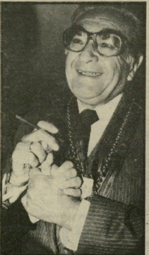
דולצ'ין במיסדר אבירי-הגריל

דולצ'ין הוא אורח כבוד של רמת-גן, רחובות, אשקלון, נצרת עילית, קריית-מוצקין וכרמיאל ויקיר המועצה המקומית דלית אל-כרמל; הוא גר ברנור בכנרת-לאומית-ישראל וגוברנור של מועצת-הנגידים של קרית-היסוד; הוא חבר-כבוד בחברת-הנאמנים של האוניברסיטה העברית, חבר הנהלת אוניברסיטת תל-אביב, חבר בחבר הנאמנים של אוניברסיטת חיפה, חבר