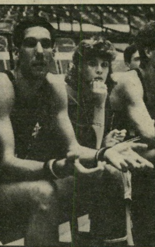
כדורסלן ג'מצי יש אינדיקציה

אותה עוד כבתי-הספר היסודי הלל, כשהיה בכתה ח', והיא למדה בכתה ו'. השניים לא עוזבים אחד את השני. מירב, בחורשים הראשונים להריגה, מלווה אותו למישחקים ואף לאימונים. דורון הולך איתה לקניות ולסידורים שונים.